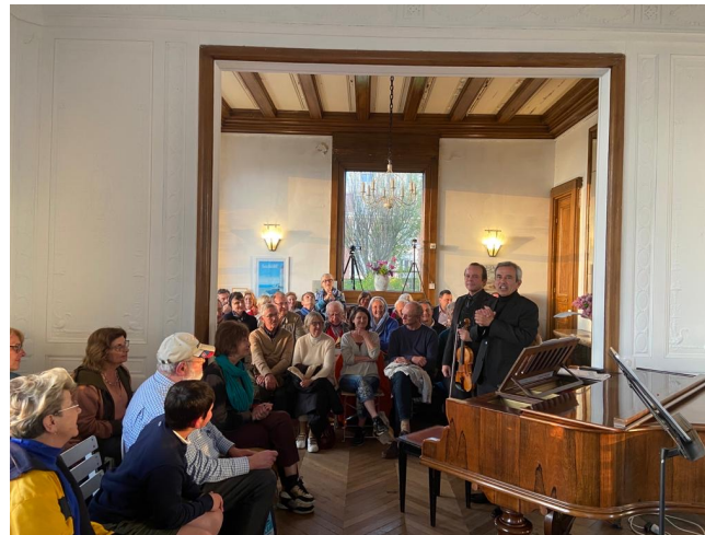
L'heure exquise Avril Mai 23 – Villa La Sablonnière à Trouville-sur-Mer – 160 personnes