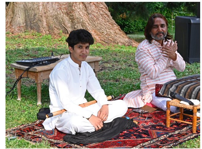
Voyage sonore, concert méditatif au Radjastan juin 23 – Parc du Château d'Aguesseau à Trouville-sur-Mer – 150 personnes