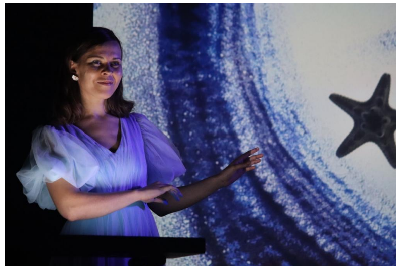
La petite sirène décembre 32 – Cinéma Théâtre de Blonville-sur-Mer – 150 personnes – spectacle jeune public

Le Cercle va permettre de financer de nouveaux spectacles , de l'achat d'espaces publicitaires, de cocktails pour le public, de places gratuites pour le jeune public ou les personnes en difficulté.